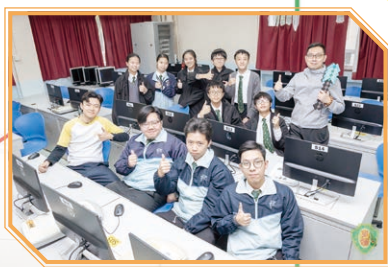
「一小時編程」™團體大挑戰 Hour of Code Challenge 2019