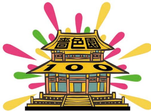
晉色園一百周年紀念標誌設計比賽 亞軍：5B 關升浩 獲獎作品