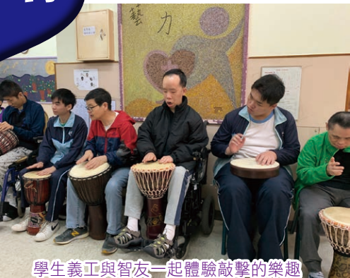
學生義工與智友一起體驗敲擊的樂趣