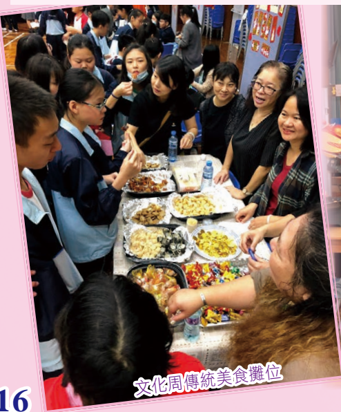
文化周傳統美食攤位

家長教師會每年均積極舉辦及協辦各類的活動，如鏢水仙球工作坊、中華文化週、繽紛美食迎聖誕及開心水果攤位日等，藉此加強家長與教師之間的聯繫溝通及合作，從而使家庭教育與學校教育起相輔相承之效。