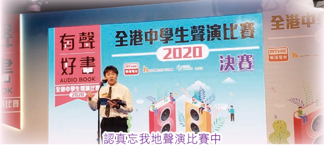
認真忘我地聲演比賽中