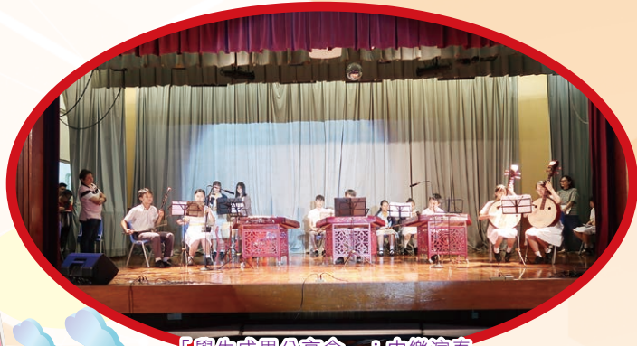
「學生成果分享會」：中樂演奏