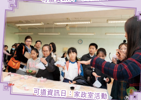
可道資訊日：家政室活動