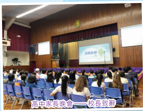
高中家長晚會——校長致辭

生涯規劃組透過舉行不同類型的升學及就業輔導活動，如：升學講座、職業探索、參觀大專院校、工作見習計劃、參觀企業、全級中六及其他小組輔導活動等，協助學生了解自己、發掘潛能；繼而認識社會，及早訂立不同的人生目標。