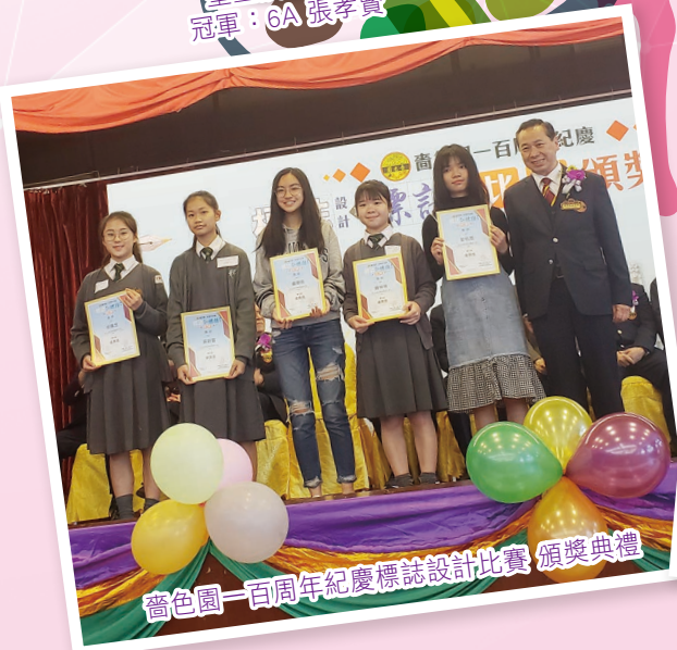
晉色園一百周年紀念標誌設計比賽 頒獎典禮