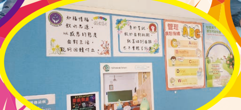
校園內張貼本年度的品德主題