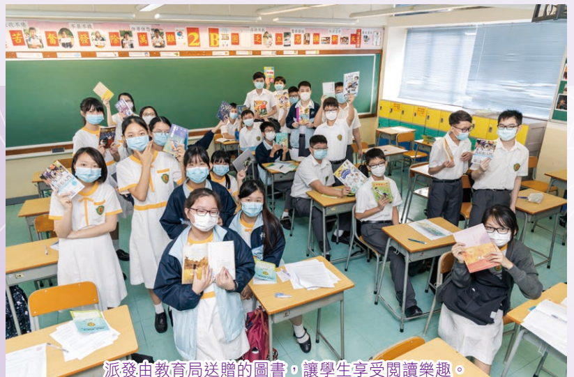
派發由教育局送贈的圖書，讓學生享受閱讀樂趣。