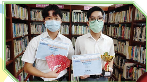
「保良局iSTEM科創建構未來」獲獎者