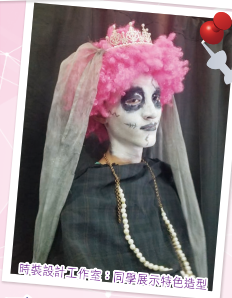
時裝設計工作室：同學展示特色造型