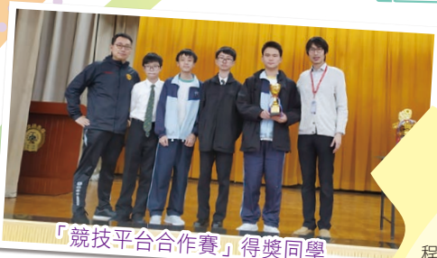
「競技平台合作賽」得獎同學