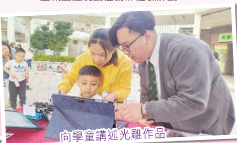
向學童講述光雕作品