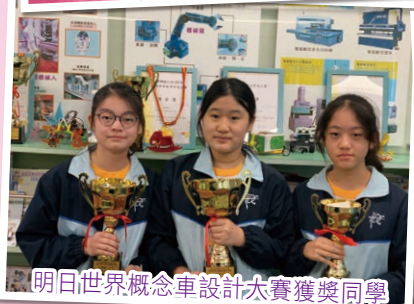
明日世界概念車設計大賽獲獎同學