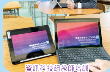
資訊科技組教師培訓