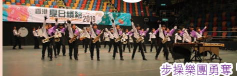
步操樂團勇奪「傑出表演獎」