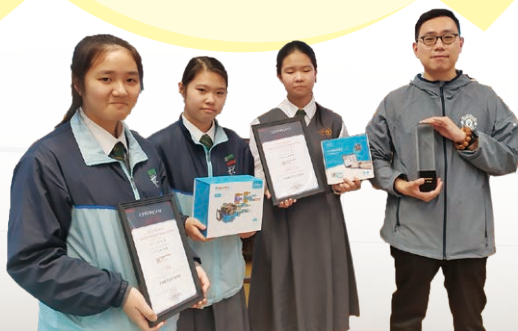
2019 MakeX Spark Online Competition得獎師生合照