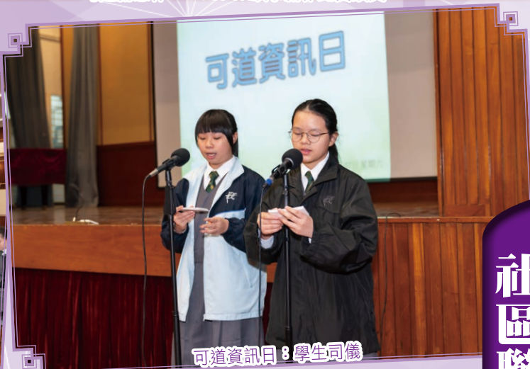
可道資訊日：學生司儀