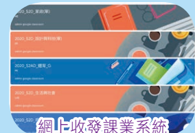
網上收發課業系統