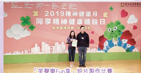
「笑聲樂Fun享」短片製作比賽