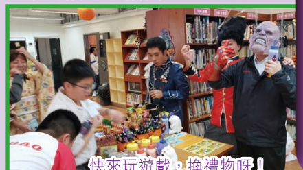
快來玩遊戲，換禮物呀！