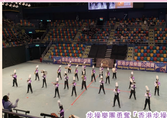
步操樂團勇奪「香港步操樂團公開賽2019」銀獎