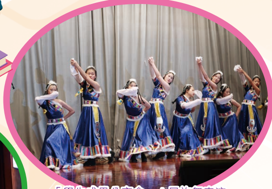
「學生成果分享會」：民族舞表演