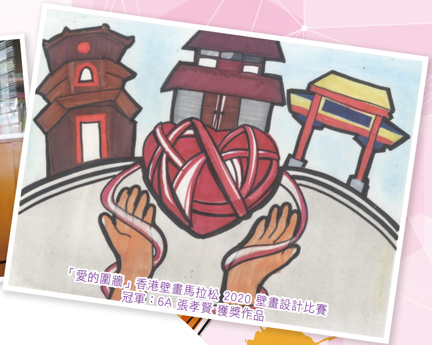
「愛的圍牆」香港壁畫馬拉松 2020 壁畫設計比賽 冠軍：6A 張孝賢 獲獎作品

視覺藝術科為了讓學生盡展所長，從創作中提升自信心，故鼓勵學生參與多元化的比賽，而學生在創作的過程中，能培養對視覺藝術的鑑賞能力。學生亦參加多項比賽，表現優秀，獲得不少獎項，令人欣喜。此外，又透過時裝設計工作室，讓同學把視覺藝術所學的知識加以應用，透過工作室模式，讓同學體驗時裝設計及製作的流程，從中獲得更多經驗，鞏固所學。