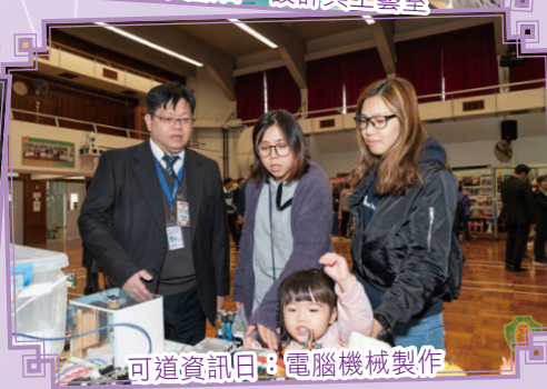
可道資訊日：電腦機械製作