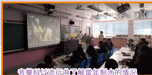
音樂科以流行曲了解當年制水的情況