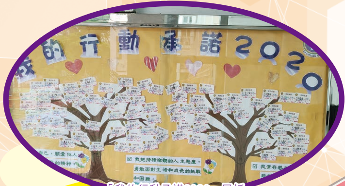
「我的行動承諾2020」展板