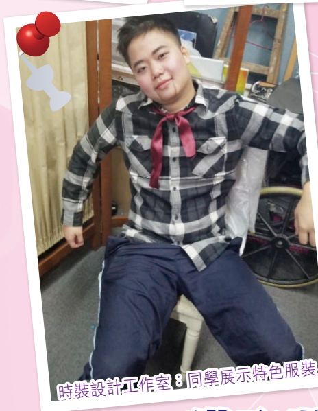
時裝設計工作室：同學展示特色服裝