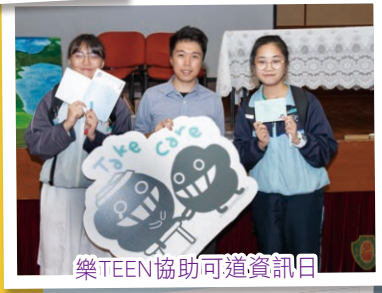
樂TEEN協助可道資訊日