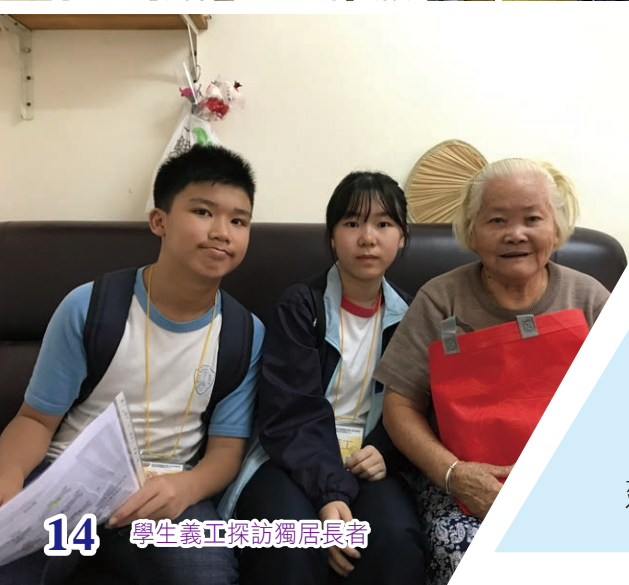
14 學生義工探訪獨居長者

德育及公民教育組透過課程、活動及師生日常接觸三方面推行品德情意及價值教育。課程方面，設立品德教育班主任課、薈色園中學聯校德育課程，加強德育及個人成長教育。多元化活動包括：教育局「愈感恩、愈寬恕、愈快樂計劃」、探訪獨居長者、與智障人士一同參與敲擊樂及陶藝體驗活動等，過程中讓同學明白社會上有不少弱勢社群努力生活的一面，從而學會尊重及接納他人。我們期望學生在完成六年的學習生活後，能培養常存感恩之心，感受他人善意與關懷，並能加以回報，建立積極、有意義的人生。