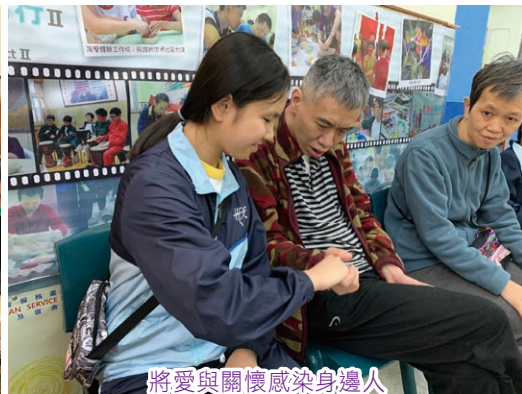
將愛與關懷感染身邊人