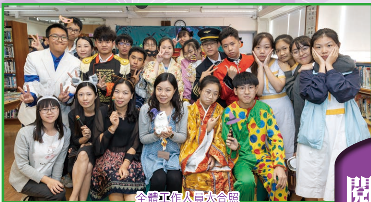
全體工作人員大合照

2019年10月31日，圖書館首次與英文科及學生會合作，學生會成員落力扮鬼扮馬，在萬勝節當天舉行圖書推廣活動，讓同學在活動中愉快學習與萬勝節相關的英文詞彙及文化。