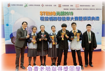
負責老師與得獎同學