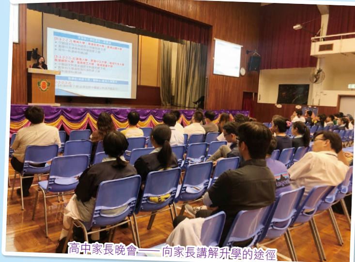
高中家長晚會——向家長講解升學的途徑