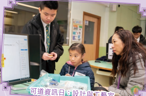
可道資訊日：設計與工藝室