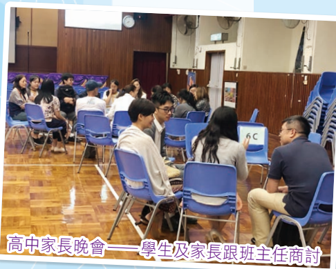
高中家長晚會——學生及家長跟班主任商討