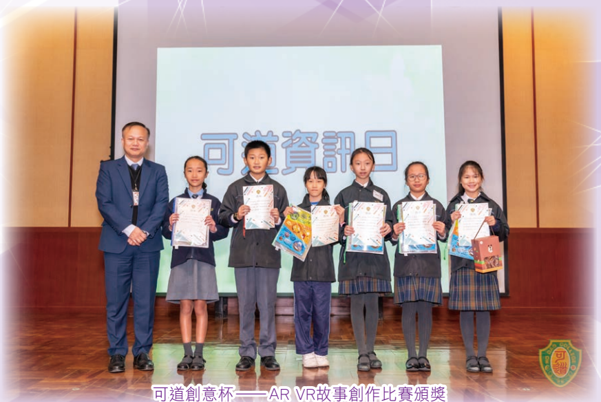
可道創意杯——AR VR故事創作比賽頒獎

作為社區的一分子，本校舉辦不少活動或同樂日，藉此增加校外人士對本校的認識，並讓本校與社區有緊密的伙伴合作關係。於2019年12月7日，舉辦「可道資訊日」，對象是小學生及家長，當天有學生課堂體驗活動，學校社工及樂Teen大使協助小學生認識本校。此外，亦有分組活動，讓本校家長與小學生家長分享經驗，小學生與家長亦一起參觀校園、並透過禮堂展板介紹、對成長支援措施及建構以學生為本的理想校園有更深認識。