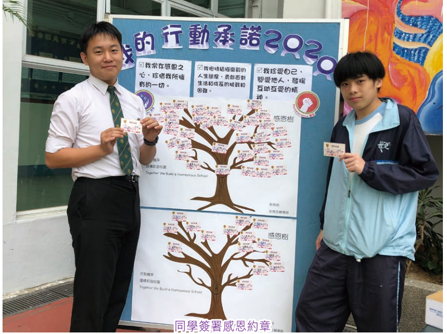
同學簽署感恩約章