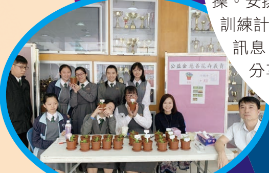
公益金慈善花卉義賣