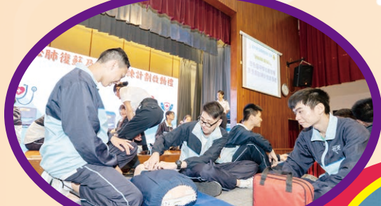
心肺復蘇及急救訓練計劃啟動禮