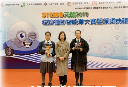
本校勇奪速度賽冠軍及亞軍