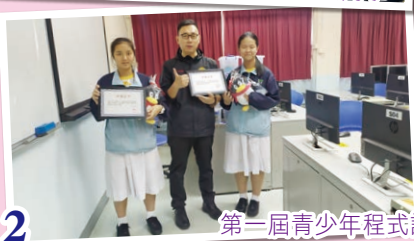
第一屆青少年程式設計追夢營(港澳)