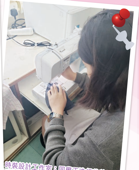
時裝設計工作室：同學正進行裁剪工序