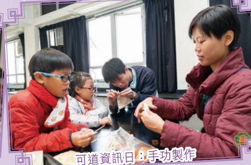
可道資訊日：手功製作