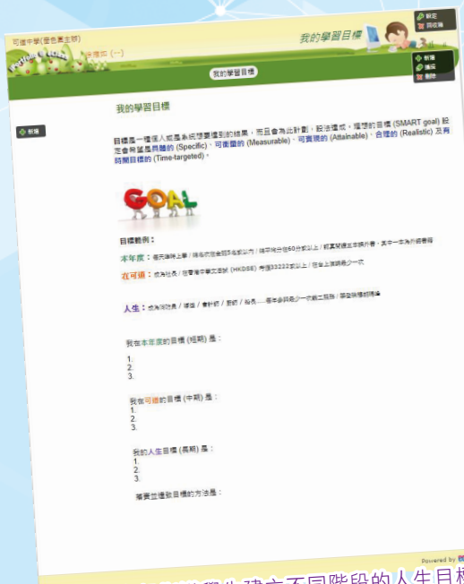
自初中起指導學生建立不同階段的人生目標