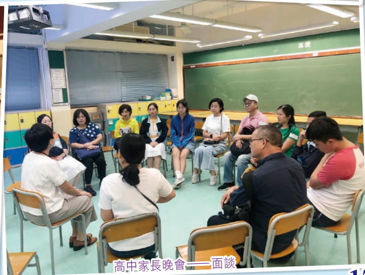
高中家長晚會——面談