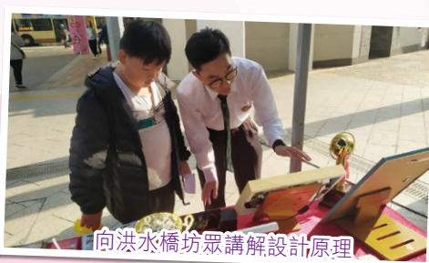
向洪水橋坊眾講解設計原理