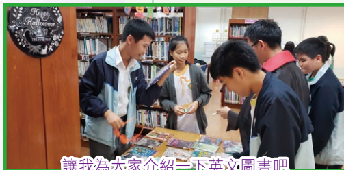
讓我為大家介紹一下英文圖書吧