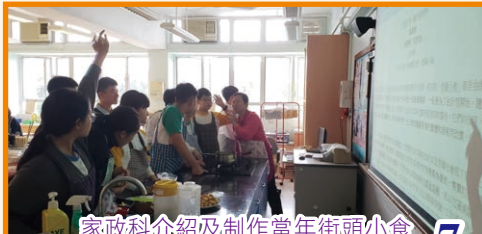
家政科介紹及制作當年街頭小食

圖書館連繫了家政科、音樂科、體育科、視藝科及通識科，在中一級進行跨學科的主題學習——「老香港」，各科以科本角度去看看昔日的老香港的各種舊情懷。各科在課堂上進行相關的閱讀教學，利用「閱讀」帶出及加深同學對香港的認識，並完成閱讀報告。為了增加是次活動的趣味，閱讀報告改以「書仔」形式去設計，以達至藝術及文字並重。