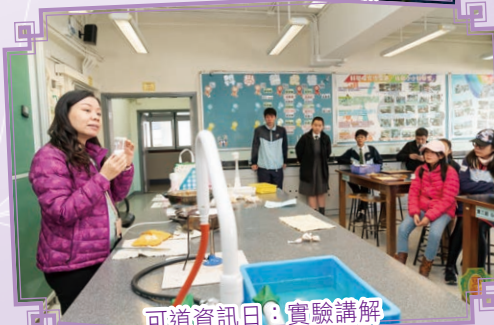
可道資訊日：實驗講解