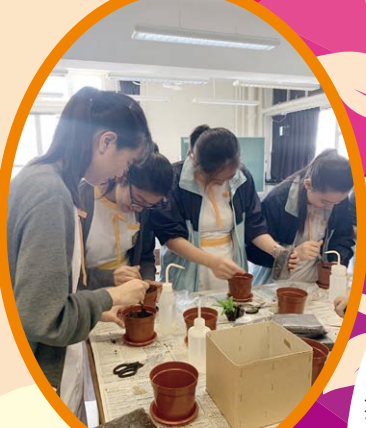
學生製作義賣花卉

本校著重學生的品格培育、價值觀及身心靈的發展。本年度以感恩、堅毅為品德主題，培育學生良好品格。舉辦「好人好事」徵集大行動，利用展板展示，營造感恩身邊人和互相讚賞的校園氣氛。製作「我的行動承諾2020」展板，鼓勵同學建立目標，坐言起行。舉辦公益金慈善花卉義賣及有機耕種活動，以培養同學關懷別人以至大自然的情操。安排部分同學參與耆色園中學心肺復蘇及急救訓練計劃啟動禮，以傳遞珍惜生命，注意健康的訊息。每年學期末，於禮堂舉辦「學生成果分享會」，全校師生見證同學在該年度的優秀表現，讓同學互相欣賞，加強對學校的歸屬感。