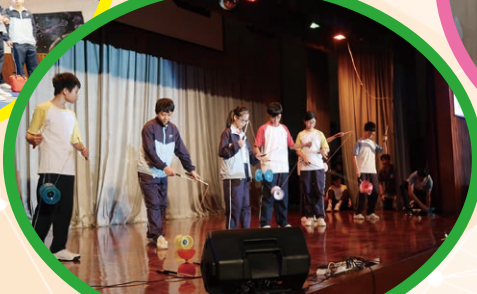
「學生成果分享會」：雜耍