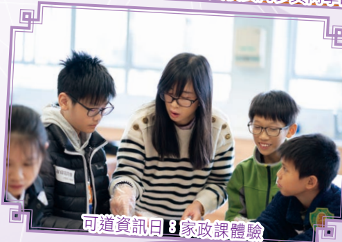
可道資訊日：家政課體驗