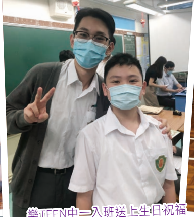
樂TEEN中一入班送上生日祝福