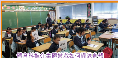
體育科推介集體遊戲如何鍛鍊身體