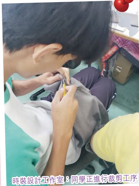
時裝設計工作室：同學正進行裁剪工序