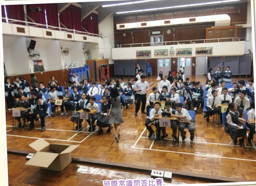
班際常識問答比賽