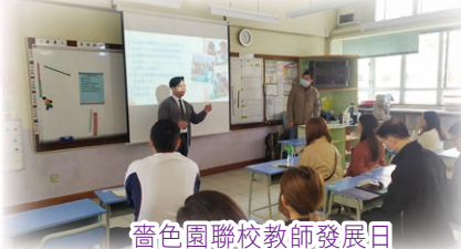
粵色園聯校教師發展日