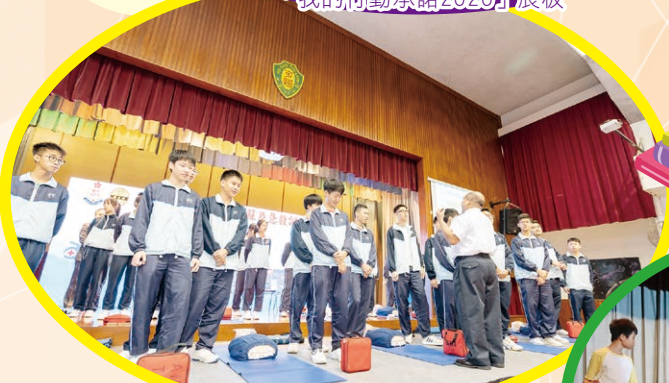
導師向學員講解急救事項