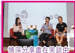
情深分享盡在笑談中