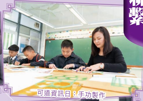
可道資訊日：手功製作