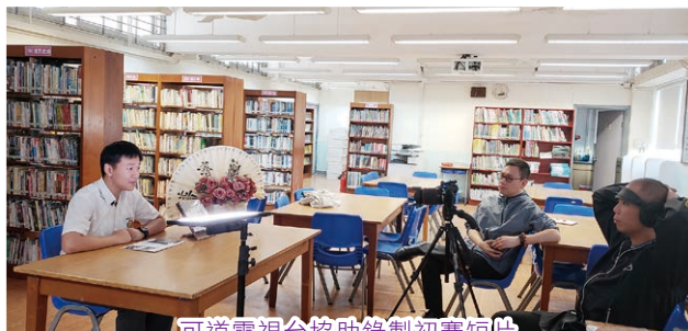
可道電視台協助錄製初賽短片