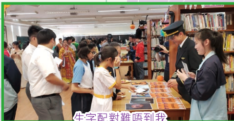
生字配對難唔到我