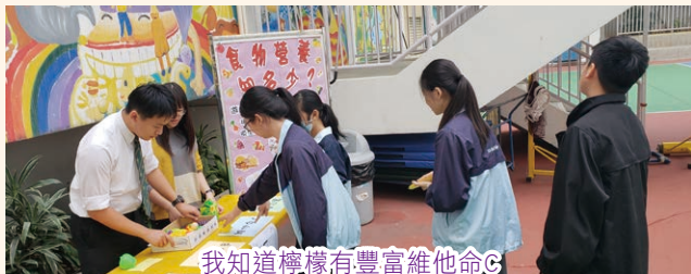
我知道檸檬有豐富維他命C