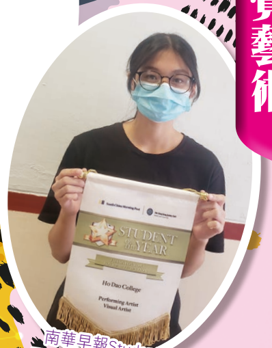
南華早報 Student of The Year: Visual Artist 1 st Runner up