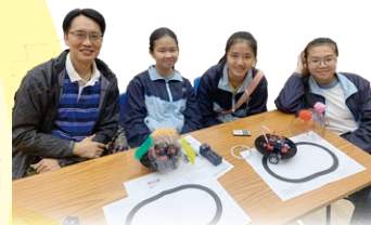
STEM@元朗2019「程控循跡智能車工作坊」

在教學經驗分享上，本校學生出席奮色園聯校教師發展日分享STEM的教學心得。本校STEM教師團隊更勇奪「STEM教育與電子學習教案設計」多項獎項。本校在發展STEM從課程培訓及比賽實踐，令學生對科學技術產生興趣，從而轉化出無限的創意及學習動力。