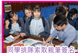
同學排隊索取親筆簽名