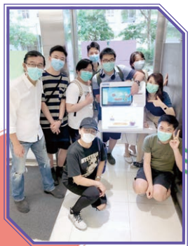
AI智能商店工程計劃

本校著力推行STEM教育，分別從課程培訓及比賽實踐推動本校的創科發展。課程培訓方面，校內課程包括：人工智能及機械人課程、運用電腦學習繪圖設計、「一小時編程」™團體大挑戰 Hour of Code Challenge 2019 及3D打印課程。在圖書館內設立了閱讀閣，提供與STEM相關而富趣味及生活化的圖書，增添更多有關科技的圖書。