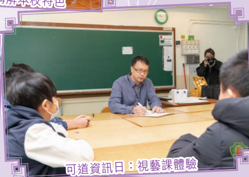
可道資訊日：視藝課體驗