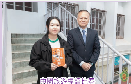
中國旅遊標語比賽