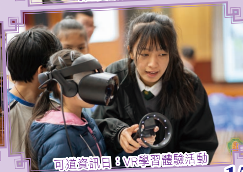
可道資訊日：VR學習體驗活動