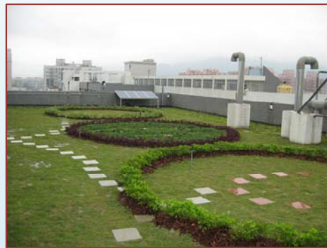
綠頂上的能源教室