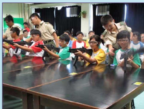
中一同學參與射擊活動