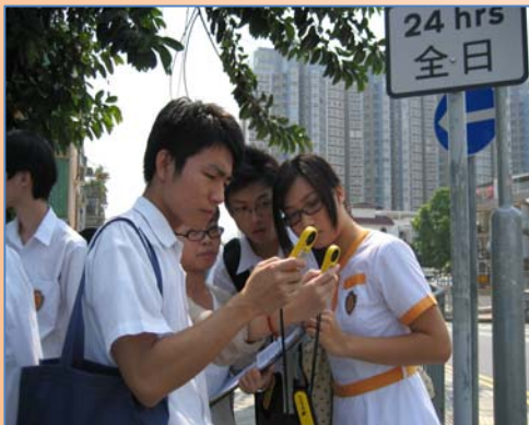
元朗明渠熱島效應考察