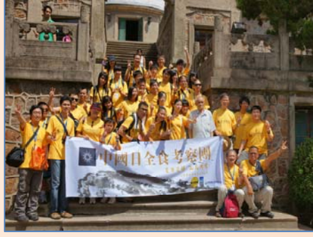
中國日全食考察團