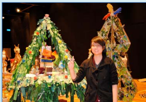
全港環保聖誕樹設計比賽