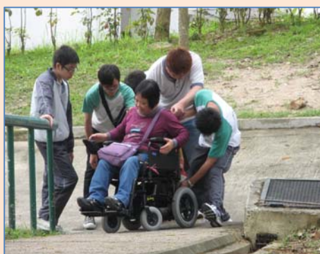
傷健共融體驗日營