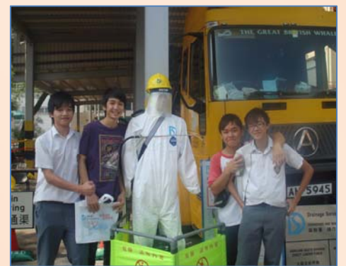
參觀沙田污水處理廠