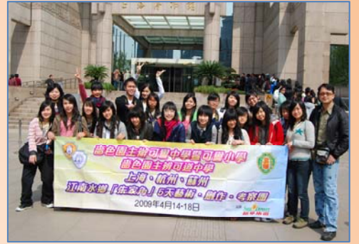
江南朱家角考察團