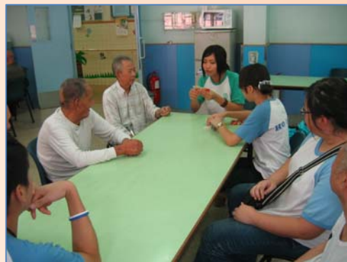
楊晉培安老院探訪