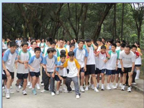
中一級班際越野賽

爲了培養學生自律守規、尊重他人的良好品德，本校提供三位駐校專業社工，重視訓育輔導合作，使他們在學業、群性、感情方面得到充分的發展，爲成爲負責的成年人作好準備。中一級的活動如「關懷伙伴」計劃、實行雙班主任制等，以加強對中一學生的關顧及成長。其他如「可道星閃閃」獎勵計劃、「飛躍 Teen 地」獎勵計劃、「同步新里程」計劃、多元智能躍進計劃、拉闊 teen 空獎勵計劃、更新先鋒計劃、智 cool 攻略、各級成長小組等，以培養融洽有序的校園生活。