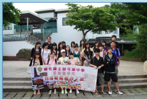
台灣藝術考察活動